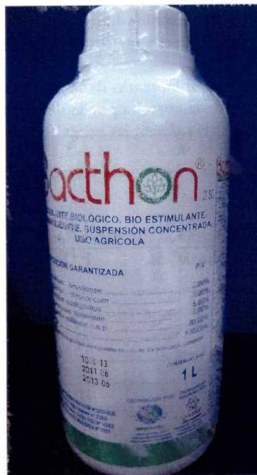
Figura N° 1: Producto Bacthon SC, presentación de 1 lt.